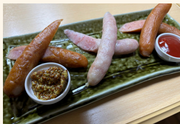
-ソーセージ盛り合わせ-